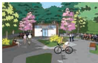
综合服务区效果图