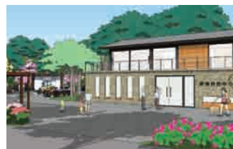
综合服务区驿站效果图