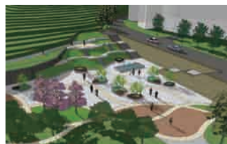
综合服务区主要节点效果图